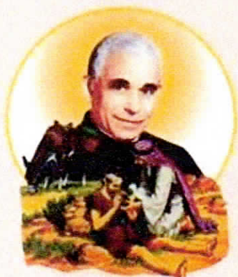
POUSADA BOM SAMARITANO COMUNIDADE TERAPÊUTICA

Registro no Cartório de Imóveis e Anexos de Dracena - Sob nº320 fls. 48 livro "A3" Pessoas Jurídicas em 23/06/1995 Utilidade Pública Municipal Lei nº. 2.660 de 25/10/1996- Utilidade Pública Estadual Lei nº 10.402 de 05/11/1999 Utilidade Pública Federal - Processo MJ nº 19.277/98-41- Decreto de 05/10/1999 Registro no CNAS- Resolução nº214 de 17/08/1999- DOU de 10/08/1999- Processo nº 44006.001894/99-11